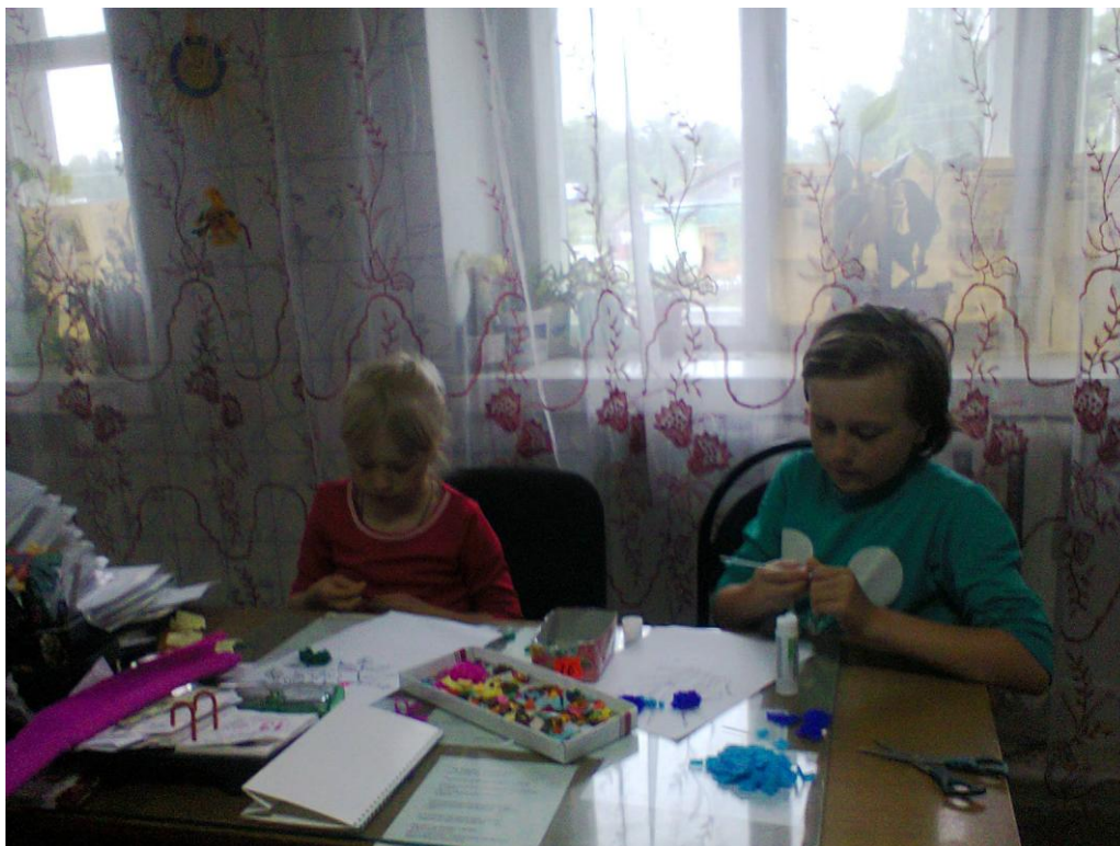
Изготовление подарочной открытки для юбиляраши.